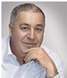
Михаил Сафарбекович ГУЦЕРИЕВ

Менеджер года 2008 в номинации «Банкир года» (журнал «Компания»). 139 место в рейтинге «200 богатейших бизнесменов России» в 2015 г. (журнал «Форбс»). Входит в ТОП-4 лучших руководителей в рейтинге «ТОП 1000 российских менеджеров» в 2014 г. (Ассоциация менеджеров России).