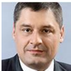
Микаил Османович ШИШХАНОВ

Менеджер года 2008 в номинации «Банкир года» (журнал «Компания»). 139 место в рейтинге «200 богатейших бизнесменов России» в 2015 г. (журнал «Форбс»). Входит в ТОП-4 лучших руководителей в рейтинге «ТОП 1000 российских менеджеров» в 2014 г. (Ассоциация менеджеров России).